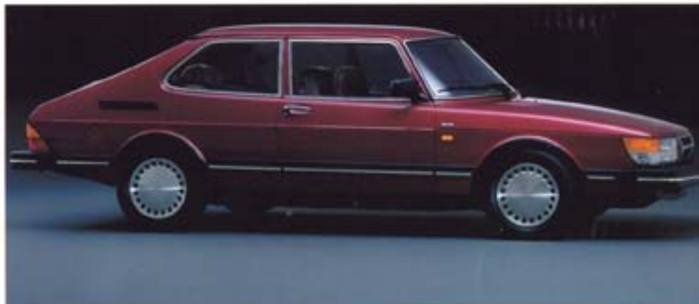
3-ovinen Saab 900i

Saab 900i on suorituskykyinen edustusauto. Tilava ja viimeistelty matkustamo takaavat väljyyden ja korkealuokkaisen matkustusmukavuuden viidelle henkilölle.