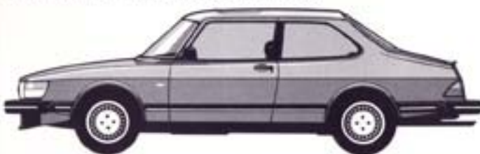
2-ovinen Saab 900i Special Sedan, lisäksi mallistossa 2-ovisena Saab 900 Turbo

Saab 900-sarjan peruskorimallit, joiden mukaan voi myös mallikohtainen vakiovarustelu vaihdella.