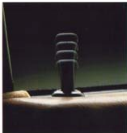
Saab 900i-malleihin voi saada erikoisvarustuksena rym-keskuskäytösjärjestelmän.