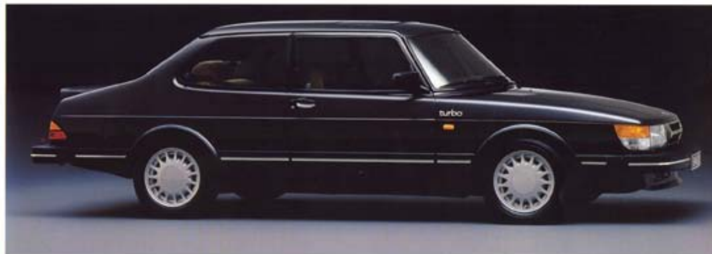
Mallivuoden 1986 uutuus: 2-ovinen Saab 900 Turbo, mm. sähköiset lasinnoistimet ja sähköiset taustapeilit sekä kattoluukku saatavana erikostlausesta.

Saab 900 Turbo on 900-sarjan suoritusarvoisin auto. Saab 900 Turbossa on 8 venttiilinen moottori. Turboahtimella ja ahtoilman välijäähdyttimellä moottorista saadaan tehoa 155 hv DIN, joka takaa tälle autolle poikkeuksellisen suorituskyvyn.