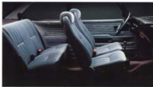
Saab 90:ssä on vakiovarusteena plyyshiiverhoilu, joka on yhtä miellyttävä niin kesällä kuin talvella.

Hyvän näkyvyyden, järkevästi sijoitettujen mittareiden ja säätimien vuoksi Saabilla ajon aikana ei tarvitse miettiä itse ajamista, vaan voidaan keskittyä liikenteen tarkkailuun.