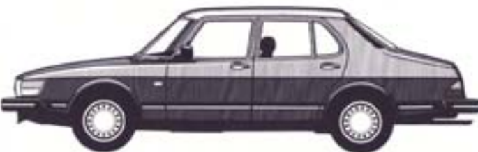
4-ovinen Saab 900 Sedan, lisäksi mallistossa 4-ovisena Saab 900i ja Turbo