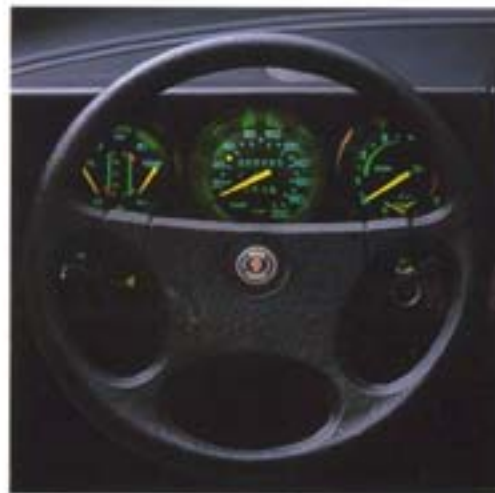
5-vaihteisessa mallissa vakiovarustukseen kuuluu taloudellisen ajon osoittava kyltinopeusmittari. Mittareissa on miellyttävä vihreä valaistus, jonka voimakkuuden voi säätää.

Saab 90 on auto niille, jotka haluavat käyttövarmun, helppohuoltoisen ja käyttökustannuksiltaan edullisen auton.