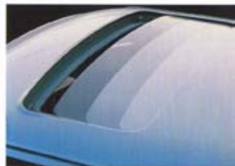
Kattoluukun voi erikoistilauksesta saada 5-vaihteiseen Saab 90-malliin jo tehtaalta asennettuna.

5-vaihteinen, 2-ovinen Saab 90, kattoluukku lisävarusteena.