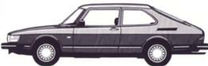
3-ovinen Saab 900 Combi Coupé, lisäksi mallistossa 3-ovisena Saab 900i ja Turbo