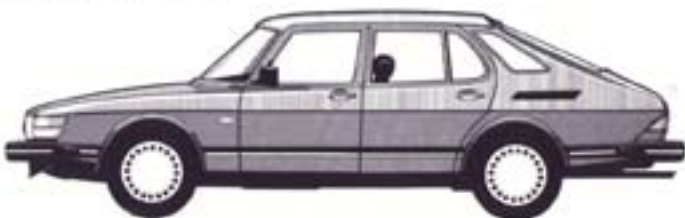
5-ovinen Saab 900i Combi Coupé, lisäksi mallistossa 5-ovisena Saab 900 Turbo

Saab 900i 4-ov. matkustamo, takaistuimen päätuet ja radio lisävarusteena.