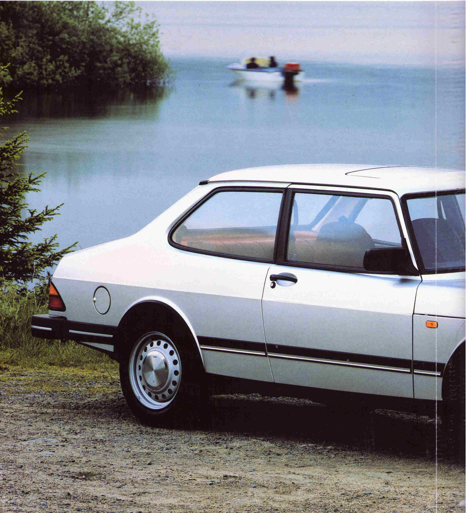
Saab 90 / årsmodell 1987